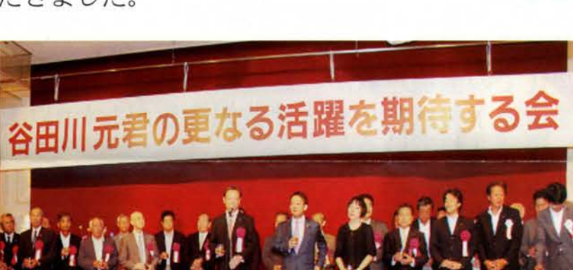
乾杯の発声を行う長浜官房副長官(現環境大臣)