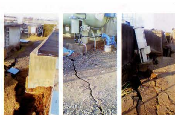
震災により被災した神宿浄水場