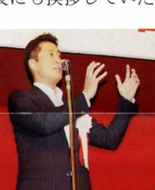
熱弁をふるう細野豪志環境大臣(現民主党政調会長)