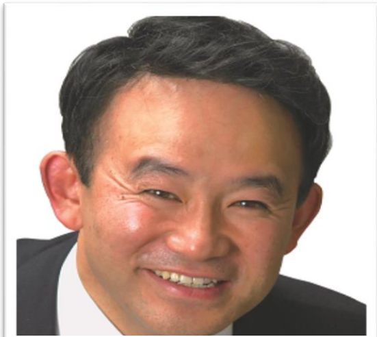
元衆議院議員 谷田川 はじめ

民進党千葉県第10区総支部 〒287-0001 千葉県香取市佐原口 2164-2 TEL0478-54-5678 FAX0478-52-6991 Mail:info@hajime-yatagawa.com